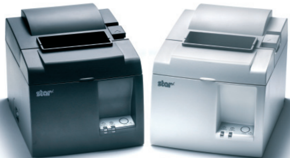
Höghastighets USB-gränssnitt med valbar serieportemulering