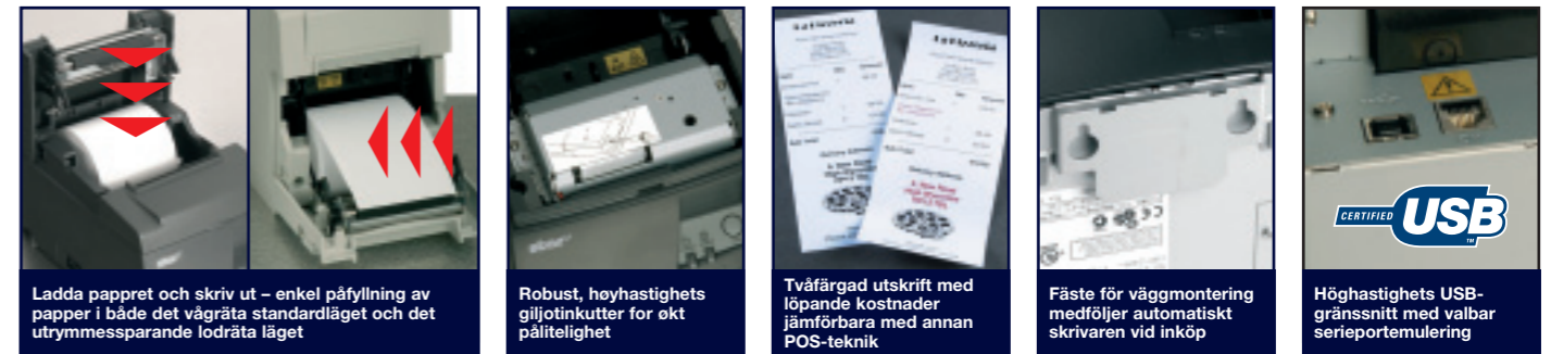
Ladda pappret och skriv ut – enkel påfyllning av papper i både det vägräta standardläget och det utrymmessparande lodräta läget

Resultat vid utskrift av 80 mm brett x 150 mm långt kvitto med Microsoft Windows XP på en dator med CPU 2,3 GHz och 512 MB RAM