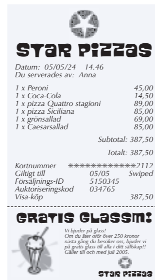
Typiskt exempel på kvitto med True Type-teckensnitt och grafik