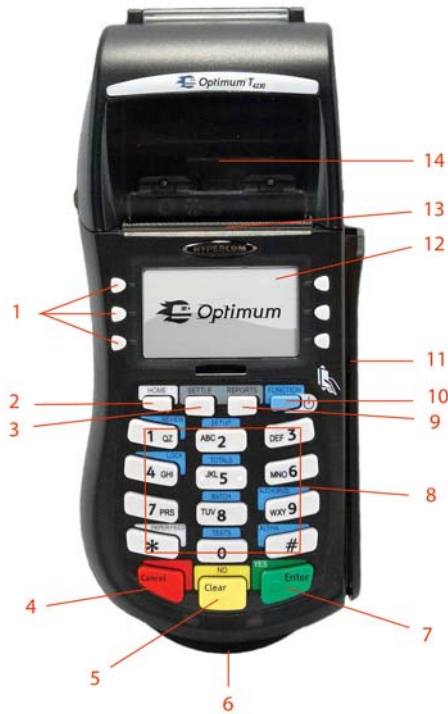
Bild 1. Framsidan av terminalen